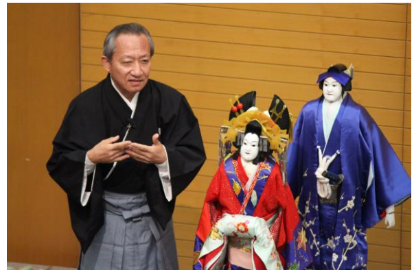
昨年のレクチャーの様子（『ひらかな盛衰記』）